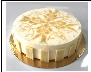
REBECCA TAART 8-10 PERSONEN

Rood fruit mousse, kersencremeux, frambozen pate de fruit en Bretons zanddeegbodem € 24,50