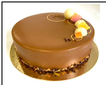
CHOCOLOCO TAART 8-10 PERSONEN

Guave mousse, cocos pate de fruit, chocolade cremeux, gezouten kaneel karamel en krokante cocosnootbodem