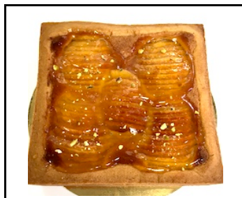
APPEL TAART 8-10 PERSONEN

Bretons zanddeeg, cake, gepocheerde peer en karamelgelei € 17,95