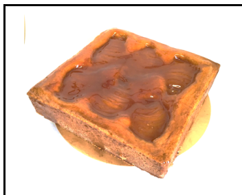
PERENTAART 8-10 PERSONEN

citroencremeux, bodem van fonceerdeeg en bovenop gebruneerde limoenmeringue € 11,95