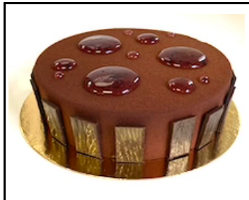
CHOCOLADE- FRAMBOZEN TAART 8-10 PERSONEN

Vanille mousse, pistache cremeux, financier, dark cacao Bretons deegbodem € 26,50