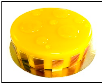
TROPISCH FRUIT TAART 8-10 PERSONEN

Mango-passie mousse, mango-chili pate de fruit, chocolade cremeux, krokante bodem € 26,50