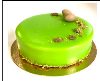
VANILLE PISTACHE TAART 8-10 PERSONEN

Witte chocolade mousse, frambozen pate de fruit, citroencremeux en Bretons zanddeegbodem € 24,50