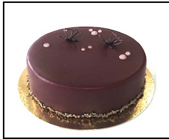
ROOD FRUIT TAART 8-10 PERSONEN

Mango-passie mousse, mango-chili pate de fruit, chocolade cremeux, krokante bodem € 26,50