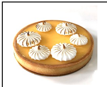
CITROEN MERINGUE 8-10 PERSONEN

Pure chocolade mousse, gezouten karamel, chocolade amandelbiscuit en pecan-cashew bodem € 26,50