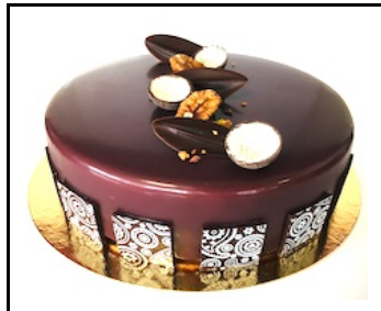
LOTTE TAART 8-10 PERSONEN

Pure chocolademousse, frambozencremeux en hazelnootfeuilletine bodem € 25,50